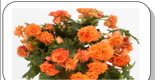
12月の花:リーガースベゴニア

千葉県 ダイナマイトなおみ 二七歳 危機感の 無い人達に マスク無し エントリーナンバー 9番 デイサービスいっぽ 新俳句大賞