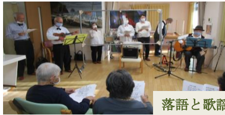
落語と歌謡ボランティア