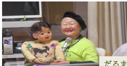
だるまとサキちゃん