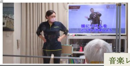
音楽レクリエーション