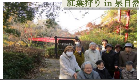
紅葉狩り in 泉自然公園