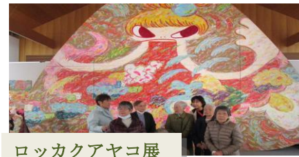
ロッカクアヤコ展