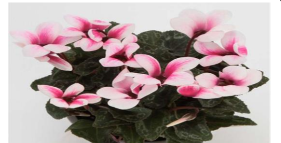
1月の花:ミニシクラメン