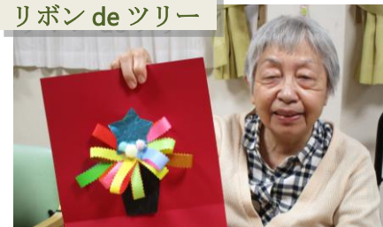
リボン de ツリー

皆様こんにちは。今年もあとわずかですが体調はいかがででしょうか。デイサービスいっぽぼでも鼻水やセキでお休みされている方が数人、見られますが他の利用者様は元気に通ってきてくださいます。この冬はコロナ感染が収まりを見せず忘年会も新年会もお預け、お正月も不要不急の外出はせず家で美味しいもの食べて早く寝る。そんなこんなで来年もよろしくお願いいたします。管理者