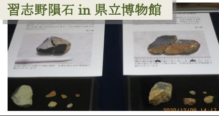
習志野隕石 in 県立博物館